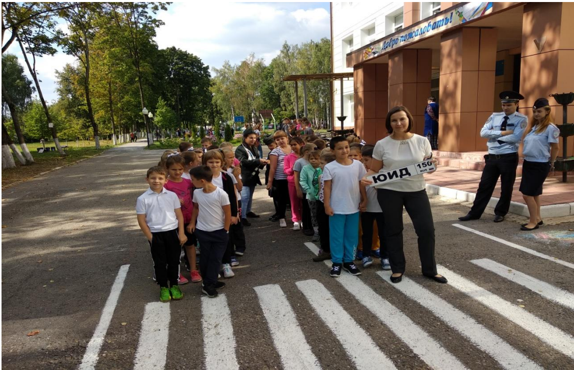
Проведение Единого дня безопасности дорожного движения