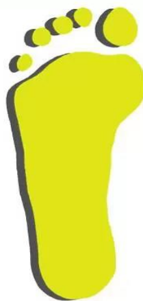
Плоскостопие 1ая степень