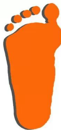
Плоскостопие 2ая степень